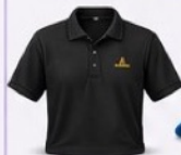
เสื้อสีดำ