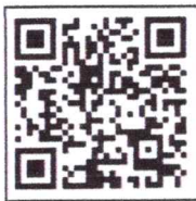
แบบสอบถาม

สำนักบริหารการทะเบียน กลุ่มงานบริหารทั่วไป โทร. ๐-๒๗๙๑-๗๖๖๔ โทรสาร. ๐-๒๗๐๖-๙๒๙๐